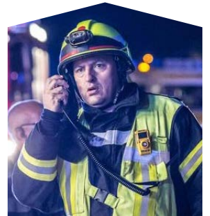
FFW Sontheim Aktuelles über die Freiwillige Feuerwehr